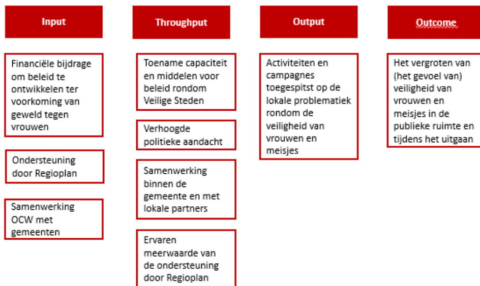
figuur 1 Beleidstheorie